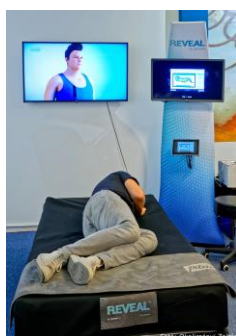
Az XSENSOR REVEAL rendszer