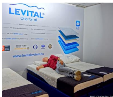
A matrac alkalmazkodik a testhelyezethez

A Levital legfontosabb tulajdonsága éppen az, hogy a több rétegű habrugós rendszer, a hűsítő memóriahab-gél és a különböző keménységű alapanyagok, valamint az egyedi ACS (Adaptive Cutting System) vágási technológia maximálisan követi a használó testsúlyát. Más típusú alátámasztásra van szüksége egy alacsony és egy magas embernek, egy soványnak