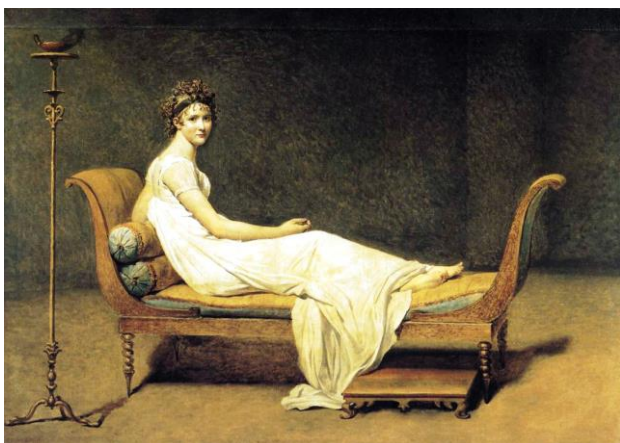
Madame Récamier Jacques-Louis David festményén, a róla elnevezett rekamién és matracon ábrázolva, 1800-ban

Az olyan fejlettebb kultúrákban, mint az egyiptomi, a görög és a római, a felsőbb osztályok már díszes ágyakat használtak, a matracot szerves anyagokkal töltötték meg: szalmával, állati szőrrel, pamuttal, tollal, pehellyel. A korai civilizációktól kezdve a középkorig a díszes ágy a jólét és a hatalom szimbóluma volt.