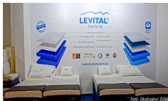
Mindenkinek a legmegfelelőbb konstrukciójú matrac

Egy jobb minőségű matrac élettartama 10–12 év, ezalatt az emberek többségében változások állhatnak be: testsúlyban, komfortérzetben, egészségi állapotban, az egyes nyomáspontok érzékenységében – gondoljunk a csípőízületre. Ezeket a módosulásokat egy hagyományos matrac nem képes követni, mert nem alkalmazkodik a megváltozott terheléshez.